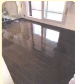
外の光が入り部屋が明るくなります